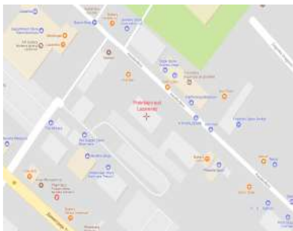
Mapa lokacije sedišta Prekršajnog suda u Lazarevcu