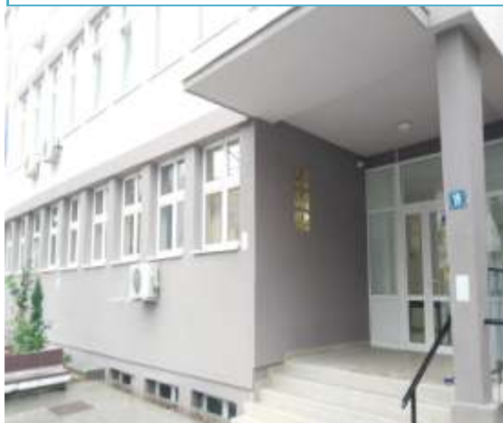
Zgrada sedišta Prekršajnog suda u Lazarevcu